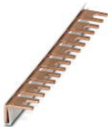
Монтажные перемычки для модуля с соединительным шагом 17,5 мм, 1-фазные, 8-полюсные

Обратите внимание на то, что приведенные здесь данные взяты из online-каталога. Полная информация и данные содержатся в документации пользователя. Действуют Общие условия использования для информации, загруженной из интернета. ( http://phoenixcontact.ru/download )