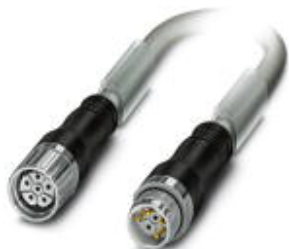
Штекерный разъем, пластиковая заливка с обеих сторон, длина: 10 м, цвет наружной оболочки: серый RAL 7001

Обратите внимание на то, что приведенные здесь данные взяты из online-каталога. Полная информация и данные содержатся в документации пользователя. Действуют Общие условия использования для информации, загруженной из интернета. ( http://phoenixcontact.ru/download )