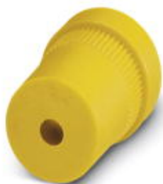
Резиновое уплотнение для резьбового крепежного элемента Pg13,5, для проводников диаметром 4,0 мм ... 6,5 мм

Обратите внимание на то, что приведенные здесь данные взяты из online-каталога. Полная информация и данные содержатся в документации пользователя. Действуют Общие условия использования для информации, загруженной из интернета. ( http://phoenixcontact.ru/download )