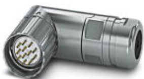
На рисунке показана 12-контактная модель изделия

Кабельный соединитель, угловой, экранирован.: есть, Винтовой зажим, M23, Полюсов: 17, тип контактов: Штифт, Подключение пайкой, диапазон диаметра кабеля: 10 мм ... 14,5 мм