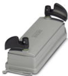
Защитная крышка HEAVYCON ADVANCE IP65 B16, с байонетным зажимом и шнуром, диаметр кольца 3 мм

Обратите внимание на то, что приведенные здесь данные взяты из online-каталога. Полная информация и данные содержатся в документации пользователя. Действуют Общие условия использования для информации, загруженной из интернета. ( http://phoenixcontact.ru/download )