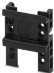
Несущая рейка Comfort, дополнительная несущая рейка для адаптера устройства Comfort

Обратите внимание на то, что приведенные здесь данные взяты из online-каталога. Полная информация и данные содержатся в документации пользователя. Действуют Общие условия использования для информации, загруженной из интернета. ( http://phoenixcontact.ru/download )