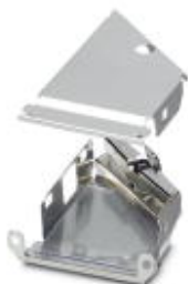
Металлический кожух D-SUB-EMV, размер 3, для сальниковых корпусов VS-25-...

Обратите внимание на то, что приведенные здесь данные взяты из online-каталога. Полная информация и данные содержатся в документации пользователя. Действуют Общие условия использования для информации, загруженной из интернета. ( http://phoenixcontact.ru/download )