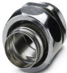
Резьбовое соединение кабеля из латуни с резьбой Pg, класс защиты IP40

Обратите внимание на то, что приведенные здесь данные взяты из online-каталога. Полная информация и данные содержатся в документации пользователя. Действуют Общие условия использования для информации, загруженной из интернета. ( http://phoenixcontact.ru/download )