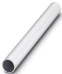
Трубка, высота 250 мм, диаметр 25 мм

Обратите внимание на то, что приведенные здесь данные взяты из online-каталога. Полная информация и данные содержатся в документации пользователя. Действуют Общие условия использования для информации, загруженной из интернета. ( http://phoenixcontact.ru/download )