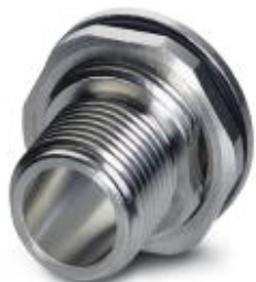
Крепежный резьбовой элемент корпуса, Штекеры, M12, Монтаж с внутренней стороны, M15 x 1

Обратите внимание на то, что приведенные здесь данные взяты из online-каталога. Полная информация и данные содержатся в документации пользователя. Действуют Общие условия использования для информации, загруженной из интернета. ( http://phoenixcontact.ru/download )