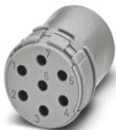
Модуль для контактов, полюсов: 7, тип контактов: Розетка, Обжим

Обратите внимание на то, что приведенные здесь данные взяты из online-каталога. Полная информация и данные содержатся в документации пользователя. Действуют Общие условия использования для информации, загруженной из интернета. ( http://phoenixcontact.ru/download )