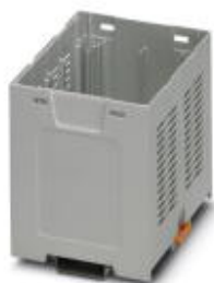
Установочный корпус, с вентиляционными отверстиями, Нижняя часть корпуса, цвет: светло-серый, ширина: 90 мм

Обратите внимание на то, что приведенные здесь данные взяты из online-каталога. Полная информация и данные содержатся в документации пользователя. Действуют Общие условия использования для информации, загруженной из интернета. ( http://phoenixcontact.ru/download )