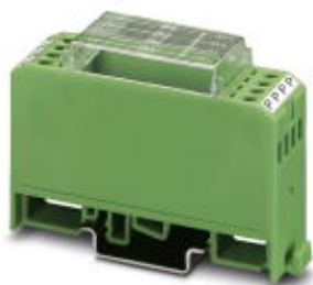
Диодный модуль, 4 диода с общим катодом, тип диодов 1N 5408

Обратите внимание на то, что приведенные здесь данные взяты из online-каталога. Полная информация и данные содержатся в документации пользователя. Действуют Общие условия использования для информации, загруженной из интернета. ( http://phoenixcontact.ru/download )