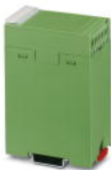
Нижняя часть корпуса с защелкой и контрольными гнездами с боковыми крышками

Обратите внимание на то, что приведенные здесь данные взяты из online-каталога. Полная информация и данные содержатся в документации пользователя. Действуют Общие условия использования для информации, загруженной из интернета. ( http://phoenixcontact.ru/download )