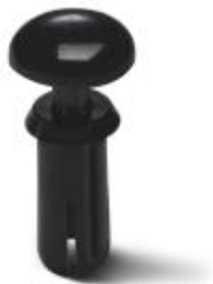
Пластиковая взрывная заклепка

Обратите внимание на то, что приведенные здесь данные взяты из online-каталога. Полная информация и данные содержатся в документации пользователя. Действуют Общие условия использования для информации, загруженной из интернета. ( http://phoenixcontact.ru/download )