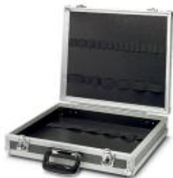
Чемодан для инструментом, пустой, с резиновыми креплениями для размещения инструмента

Обратите внимание на то, что приведенные здесь данные взяты из online-каталога. Полная информация и данные содержатся в документации пользователя. Действуют Общие условия использования для информации, загруженной из интернета. ( http://phoenixcontact.ru/download )