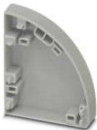
Проставка, для электрической изоляции отдельных проходных клемм, ширина: 9 мм, цвет: серый

Обратите внимание на то, что приведенные здесь данные взяты из online-каталога. Полная информация и данные содержатся в документации пользователя. Действуют Общие условия использования для информации, загруженной из интернета. ( http://phoenixcontact.ru/download )