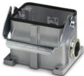
Приборный корпус с одной защелкой, высота 100 мм, с резьбовым соединением, 2x Pg29

Обратите внимание на то, что приведенные здесь данные взяты из online-каталога. Полная информация и данные содержатся в документации пользователя. Действуют Общие условия использования для информации, загруженной из интернета. ( http://phoenixcontact.ru/download )