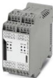
8-канальный модуль расширения HART® с винтовыми зажимами

Обратите внимание на то, что приведенные здесь данные взяты из online-каталога. Полная информация и данные содержатся в документации пользователя. Действуют Общие условия использования для информации, загруженной из интернета. ( http://phoenixcontact.ru/download )