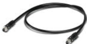
Кабель GOF MM, в сборе с M12 OPTIC на M12 OPTIC

Готовый оптоволоконный кабель, круглый, волокно GOF-MM 50/125 мкм, M12 на M12, для прокладки внутри зданий