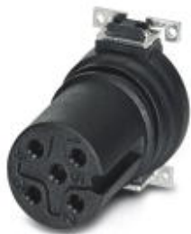
Встраиваемые разъемы, 5-полюсн., Гнездо, прямое, M12, A - стандарт, Монтаж на печатную плату, SMD

Обратите внимание на то, что приведенные здесь данные взяты из online-каталога. Полная информация и данные содержатся в документации пользователя. Действуют Общие условия использования для информации, загруженной из интернета. ( http://phoenixcontact.ru/download )