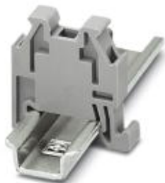
Концевой держатель для быстрого монтажа, для установки на монтажную рейку NS 15

Обратите внимание на то, что приведенные здесь данные взяты из online-каталога. Полная информация и данные содержатся в документации пользователя. Действуют Общие условия использования для информации, загруженной из интернета. ( http://phoenixcontact.ru/download )