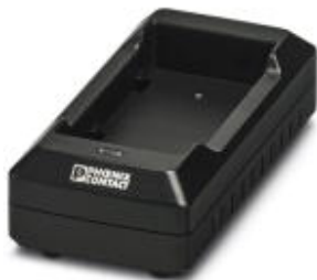
Зарядная база, для зарядки THERMOFOX/ACCU (0805009)

Обратите внимание на то, что приведенные здесь данные взяты из online-каталога. Полная информация и данные содержатся в документации пользователя. Действуют Общие условия использования для информации, загруженной из интернета. ( http://phoenixcontact.ru/download )