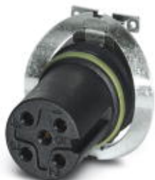
Встраиваемые разъемы, 5-полюсн., Гнездо, прямое, M12, A - стандарт, Монтаж на печатную плату, SMD

Обратите внимание на то, что приведенные здесь данные взяты из online-каталога. Полная информация и данные содержатся в документации пользователя. Действуют Общие условия использования для информации, загруженной из интернета. ( http://phoenixcontact.ru/download )