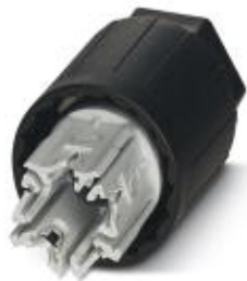
Гайки, Тип подключения QUICKON, полюсов: 4+PE, 0,5 мм 2 ... 1,5 мм 2 , 690 В, 17,5 А, черный

Обратите внимание на то, что приведенные здесь данные взяты из online-каталога. Полная информация и данные содержатся в документации пользователя. Действуют Общие условия использования для информации, загруженной из интернета. ( http://phoenixcontact.ru/download )