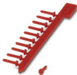
Механический ключ (штифт)

Обратите внимание на то, что приведенные здесь данные взяты из online-каталога. Полная информация и данные содержатся в документации пользователя. Действуют Общие условия использования для информации, загруженной из интернета. ( http://phoenixcontact.ru/download )