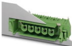
На рисунке показан 5-контактный вариант изделия

Компоненты для проходного монтажа, номинальный ток: 76 А, расчетное напряжение (III/2): 1000 В, полюсов: 9, размер шага: 10,16 мм, цвет: зеленый, поверхность контакта: Серебро, монтаж: Пайка волной припоя