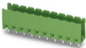
На рисунке показан 10-контактный вариант изделия

Корпусная часть для печатных плат, номинальный ток: 12 А, расчетное напряжение (III/2): 320 В, полюсов: 20, размер шага: 5 мм, цвет: зеленый, поверхность контакта: олово, монтаж: Пайка волной припоя