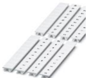
Маркировочная планка Zack, 10 элементов, с нанесенными вдоль полосы цифрами по порядку: 31 ... 40, белый, ширина: 8 мм

Обратите внимание на то, что приведенные здесь данные взяты из online-каталога. Полная информация и данные содержатся в документации пользователя. Действуют Общие условия использования для информации, загруженной из интернета. ( http://phoenixcontact.ru/download )