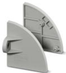
Фланец, полюсов: 0, цвет: серый

Обратите внимание на то, что приведенные здесь данные взяты из online-каталога. Полная информация и данные содержатся в документации пользователя. Действуют Общие условия использования для информации, загруженной из интернета. ( http://phoenixcontact.ru/download )