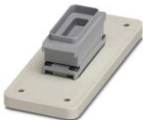
Соединительная плата, размер B16, усиленная, с монтажной рамой с защитной крышкой DSUB 9, без контактной вставки

Обратите внимание на то, что приведенные здесь данные взяты из online-каталога. Полная информация и данные содержатся в документации пользователя. Действуют Общие условия использования для информации, загруженной из интернета. ( http://phoenixcontact.ru/download )