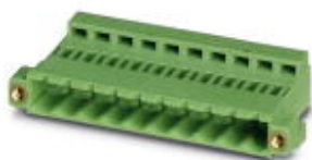
На рисунке показан 10-контактный вариант

Обратите внимание на то, что приведенные здесь данные взяты из online-каталога. Полная информация и данные содержатся в документации пользователя. Действуют Общие условия использования для информации, загруженной из интернета. ( http://phoenixcontact.ru/download )