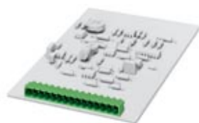
Корпусная часть для печатных плат, полюсов: 6, размер шага: 5,08 мм, цвет: зеленый

Обратите внимание на то, что приведенные здесь данные взяты из online-каталога. Полная информация и данные содержатся в документации пользователя. Действуют Общие условия использования для информации, загруженной из интернета. ( http://phoenixcontact.ru/download )