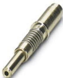
Набор запасных металлических муфт (10 штук) для оптоволоконных разъемов M12 POF (арт.№ 1416606)

Обратите внимание на то, что приведенные здесь данные взяты из online-каталога. Полная информация и данные содержатся в документации пользователя. Действуют Общие условия использования для информации, загруженной из интернета. ( http://phoenixcontact.ru/download )