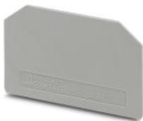
Концевая крышка, длина: 46 мм, ширина: 1 мм, высота: 28,7 мм, цвет: серый

Обратите внимание на то, что приведенные здесь данные взяты из online-каталога. Полная информация и данные содержатся в документации пользователя. Действуют Общие условия использования для информации, загруженной из интернета. ( http://phoenixcontact.ru/download )