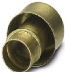
Наконечники для защиты кабеля, латунные, для WP-STEEL PVC C

Обратите внимание на то, что приведенные здесь данные взяты из online-каталога. Полная информация и данные содержатся в документации пользователя. Действуют Общие условия использования для информации, загруженной из интернета. ( http://phoenixcontact.ru/download )