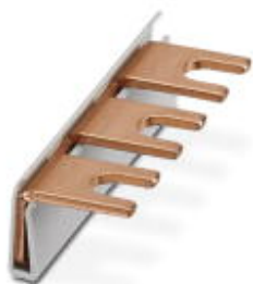
Монтажные перемычки для модуля с соединительным шагом 17,5 мм, 1-фазные, 3-полюсные

Обратите внимание на то, что приведенные здесь данные взяты из online-каталога. Полная информация и данные содержатся в документации пользователя. Действуют Общие условия использования для информации, загруженной из интернета. ( http://phoenixcontact.ru/download )