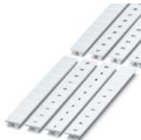
Маркировочная планка Zack, 10 элементов, с нанесенными вдоль полосы цифрами по порядку: 91 ... 100, белый

Обратите внимание на то, что приведенные здесь данные взяты из online-каталога. Полная информация и данные содержатся в документации пользователя. Действуют Общие условия использования для информации, загруженной из интернета. ( http://phoenixcontact.ru/download )