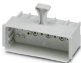
Верхняя часть контактного модуля

Обратите внимание на то, что приведенные здесь данные взяты из online-каталога. Полная информация и данные содержатся в документации пользователя. Действуют Общие условия использования для информации, загруженной из интернета. ( http://phoenixcontact.ru/download )