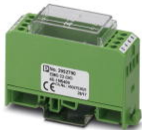
Диодная сборка, 4 диода с отдельными выводами, тип диодов 1N 5408

Обратите внимание на то, что приведенные здесь данные взяты из online-каталога. Полная информация и данные содержатся в документации пользователя. Действуют Общие условия использования для информации, загруженной из интернета. ( http://phoenixcontact.ru/download )