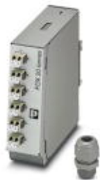
Кабельная коробка для несущей рейки, без шлейфов, для 6 LC-Duplex

Обратите внимание на то, что приведенные здесь данные взяты из online-каталога. Полная информация и данные содержатся в документации пользователя. Действуют Общие условия использования для информации, загруженной из интернета. ( http://phoenixcontact.ru/download )