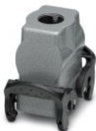
Сальниковый корпус HEAVYCON B10, с двумя защелками, высота 72 мм, с резьбой 1x M25, прямое подключение кабеля

Обратите внимание на то, что приведенные здесь данные взяты из online-каталога. Полная информация и данные содержатся в документации пользователя. Действуют Общие условия использования для информации, загруженной из интернета. ( http://phoenixcontact.ru/download )