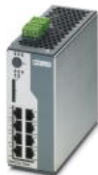
Managed Switch 7000, 8 порты RJ45 10/100 Мбит/с, степень защиты: IP20, EtherNet/IP™

Обратите внимание на то, что приведенные здесь данные взяты из online-каталога. Полная информация и данные содержатся в документации пользователя. Действуют Общие условия использования для информации, загруженной из интернета. ( http://phoenixcontact.ru/download )