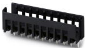
На рисунке показан 10-контактный вариант изделия

Обратите внимание на то, что приведенные здесь данные взяты из online-каталога. Полная информация и данные содержатся в документации пользователя. Действуют Общие условия использования для информации, загруженной из интернета. ( http://phoenixcontact.ru/download )