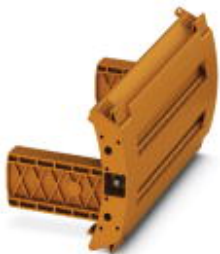
Холостой штекер, полюсов: 10, цвет: оранжевый

Обратите внимание на то, что приведенные здесь данные взяты из online-каталога. Полная информация и данные содержатся в документации пользователя. Действуют Общие условия использования для информации, загруженной из интернета. ( http://phoenixcontact.ru/download )