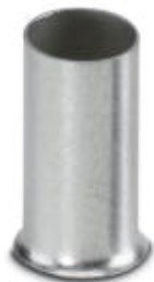
Кабельный наконечник, длина: 12 мм, цвет: серебристый

Обратите внимание на то, что приведенные здесь данные взяты из online-каталога. Полная информация и данные содержатся в документации пользователя. Действуют Общие условия использования для информации, загруженной из интернета. ( http://phoenixcontact.ru/download )