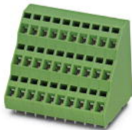
На рисунке показан 10-контактный вариант

Обратите внимание на то, что приведенные здесь данные взяты из online-каталога. Полная информация и данные содержатся в документации пользователя. Действуют Общие условия использования для информации, загруженной из интернета. ( http://phoenixcontact.ru/download )