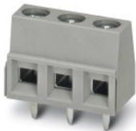
На рисунке показана модель серого цвета

Обратите внимание на то, что приведенные здесь данные взяты из online-каталога. Полная информация и данные содержатся в документации пользователя. Действуют Общие условия использования для информации, загруженной из интернета. ( http://phoenixcontact.ru/download )