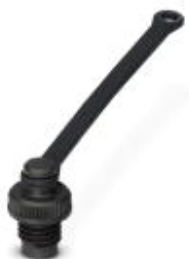
Пластиковый колпачок M8 с фиксирующим элементом для неиспользуемого гнезда M8 с фиксирующим кольцом 3,0 мм

Обратите внимание на то, что приведенные здесь данные взяты из online-каталога. Полная информация и данные содержатся в документации пользователя. Действуют Общие условия использования для информации, загруженной из интернета. ( http://phoenixcontact.ru/download )