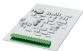
Корпусная часть для печатных плат, полюсов: 11, размер шага: 5,08 мм, цвет: зеленый

Обратите внимание на то, что приведенные здесь данные взяты из online-каталога. Полная информация и данные содержатся в документации пользователя. Действуют Общие условия использования для информации, загруженной из интернета. ( http://phoenixcontact.ru/download )